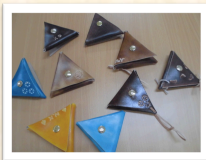
革細工 (コインケース)